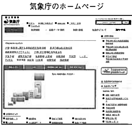
気象庁のホームページ

まずは、これらの情報の入手をはかるためにも、「気象庁」を検索し、パソコンのデスクトップに