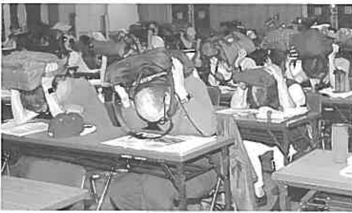
手近にあるカバン等で頭を守ることが大事

訓練の大切さは、過去の災害でも実証されています。意識して日頃から安全を守る備えを整えておきたいものです。