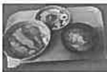
「にじ散歩」 で大人気の 日替わり 500円ランチ

ともしびショップ 「にじ散歩／ゆめ散歩」の運営 「ぱれっと・はだの」の一階に 地域交流の場として「にじ散歩」 をオープンしています。