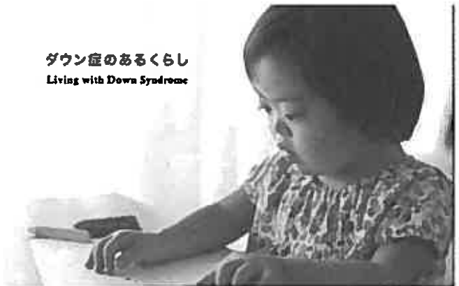
ダウン症のあるくらし Living with Down Syndrome